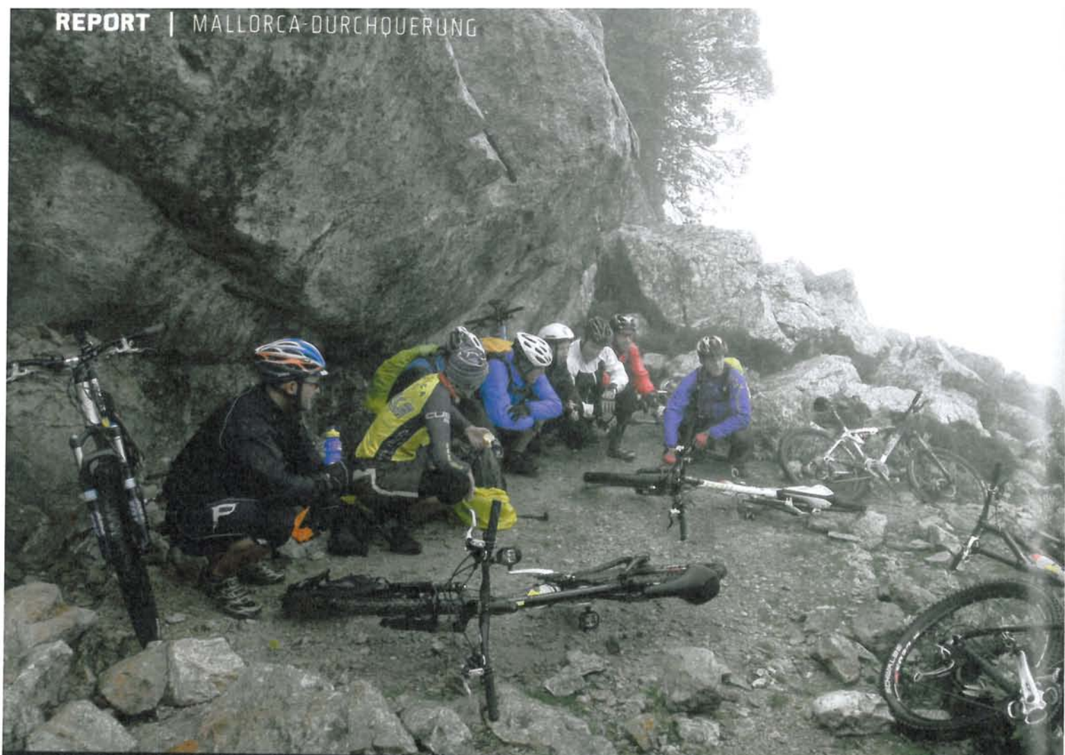
Oben brodeln das Abenteuer, unten lutschen quasinackte Menschen an Strohhalmchen: Mallorca bietet scharfe Kontraste

Bauarbeiten wurden zwangsgestoppt. Jetzt dämmert der Geisterort seinem Irgendwas entgegen. Vor zwei Jahren wurde hier tatsächlich ein Katastrophenfilm gedreht. Ein RTL-Zweiteller. Die Handlung war nicht allzu uppy.